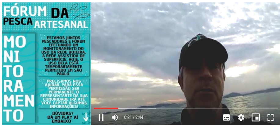
Figura 1 Material de divulgação sobre a Portaria SAP/MAPA nº 356/2021 e a necessidade de realizar o automonitoramento. Autoria: Amilton Xavier e Peterson Vieira Neves (2023).

Construiu-se uma forma de sistematização das informações por meio de planilhas compartilhadas. Em alguns casos, eram recebidas fotografias das fichas nas quais pesquisadores(as) caiçaras realizavam as anotações; em outros, os responsáveis por cada região inseriam diretamente as informações nas planilhas. Ao final, entre formulários do Google, fotografias, fichas, áudios e mensagens de texto, foram registradas informações referentes a 486 pescarias, realizadas entre maio e julho de 2022, envolvendo cerca de 70 pescadores(as) participantes do processo de automonitoramento.