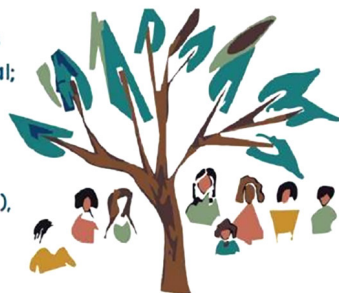
Figura 3 Divulgação dos resultados feita pela Articulação das Comunidades Caiçaras da Ilha do Cardoso.

Outro ponto a ser superado é como manter a unidade em torno dessa demanda comum — a pesca incidental com a rede boeira — e, ao mesmo tempo, conseguir regionalizar a coleta de informações, somando-a a outras demandas mais locais. Também notou-se que não há possibilidade de adotar uma estratégia única para a coleta das informações; por isso, é preciso estar aberto a customizar tanto os métodos de coleta quanto as formações necessárias dentro do processo de automonitoramento e de autogestão da informação.