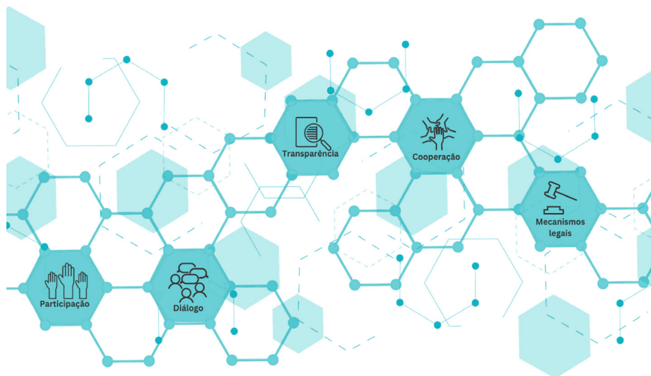
Figura 2 – Elementos da governança ambiental para a transformação de conflitos costeiros e marinhos. Autora: Luciana Xavier, 2023.